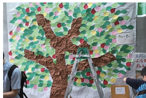
子供達の夢を書いたゆめの木