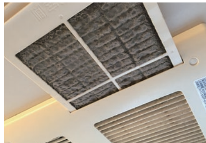
換気扇フィルター

湯アカや石鹸カスなど浴室は様々な汚れを、普段のお掃除では手に負えないところもしっかりクリーニングしていきます。(天井・壁面、床面、ドア、浴槽・浴槽のフタ、窓、蛇口・シャワーヘッド、鏡、照明、排水口、換気扇、小物(洗面器、ボトルなど))