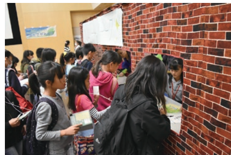
ハローワークで仕事を見つける子供達

日本では子ども環境学会でこどものまちが紹介されたことから全国に広まり、現在では大小130 くらいのこどものまちが存在します。