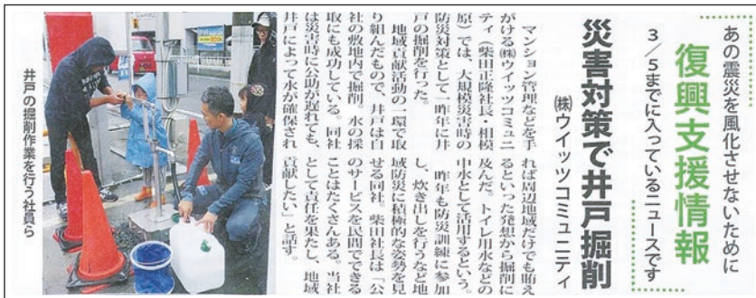
2018年3月8日付 タウンニュース

2017年4月に設置しましたウイッツ西門プラザ敷地内の井戸がタウンニュースと相模経済新聞に掲載されました。この井戸は飲料には適しませんが、主に生活用水として活用いただくことを目的として設置したものです。引き続き「みんなの井戸」として地域の皆様にいざという時に使ってもらえるように、また防災意識を高める井戸汲み体験に利用いただけるように周知してまいります。またこのような地域防災の他にも CSR 活動の一環として、様々な地域貢献に努めてまいります。