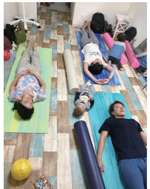
お子さんを皆で見ながら体験できます。

「産後の筋力を戻したい方、デスクワークで前かがみに強張った体を整えたいという方はピラティスを、メンタルや自律神経の乱れを整えたいという方にはヨガがオススメです。オープン記念で通常¥2,000のところ、今なら¥1,500で体験することが出来ます。」この機会に体験してみたいはいかがでしょうか？