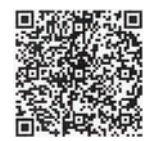
ピラティスの予約はこちらから