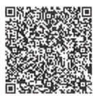
ヨガの予約はこちらから