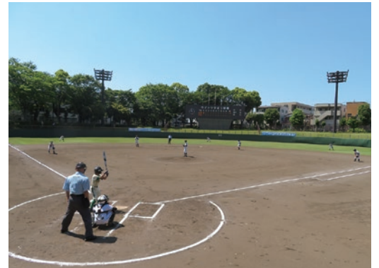
初戦から白熱した試合展開に

昨年同様29チームが参加する今大会、開会式は昨年よりネーミングライツ契約を締結させていただいております「ウイッツひばり球場」にて行われ、弊社から2名が主賓として参加させていただき、挨拶と始球式を務めさせていただきました。