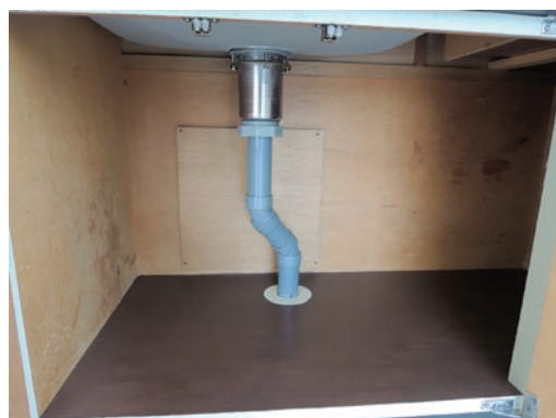
近隣とのトラブルは住みやすさにも影響します。