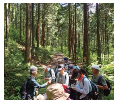
自然観察会の様子

「環境講演会」として、昨年は様々な切り口から環境に関する問題提起を行ってまいりました。今年度も魅力溢れる講演会の開催を予定しています。