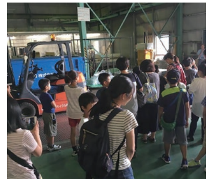
リサイクル工場見学

(7/1 環境情報センター HP より申込み開始予定 http://eic-sagamihara.jp/ )