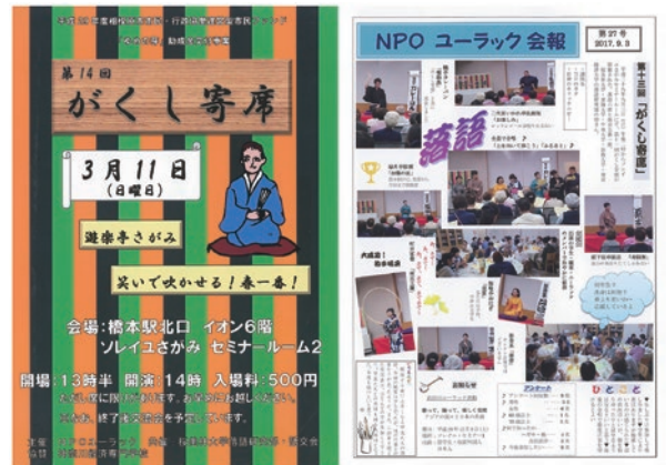
以前のチラシと会報