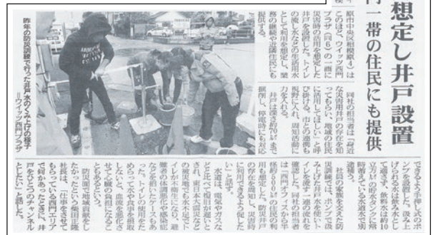
2018年4月10日付 相模経済新聞