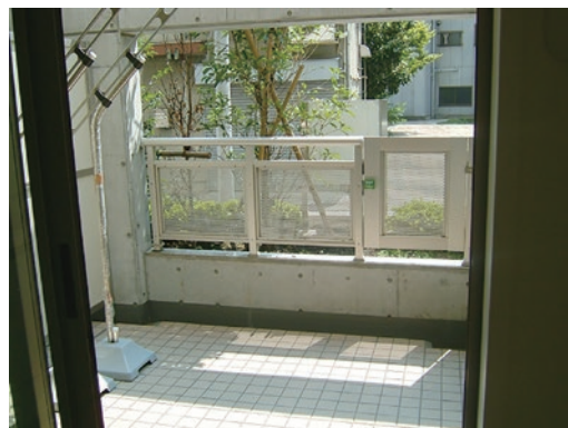
ベランダ・バルコニーの排水口はキレイにしておきましょう。

また何か起きてからではなく、起きる前に共用部分の補償内容、共用部分と専有部分の境界を確認しておくことも重要です。