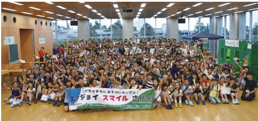
相模大野のこどものまちの集合写真

元々は1979年からドイツのミュンヘンで開催されていたイベント「ミニ・ミュンヘン」をモデルに、日本においては15年くらい前に千葉の「ミニさくら」が日本版「ミニ・ミュンヘン」の初めだと思えます。