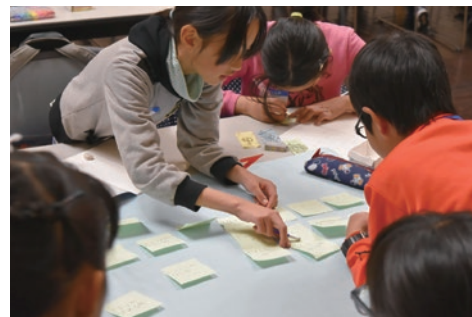
こども会議で意見を出し合う子供達